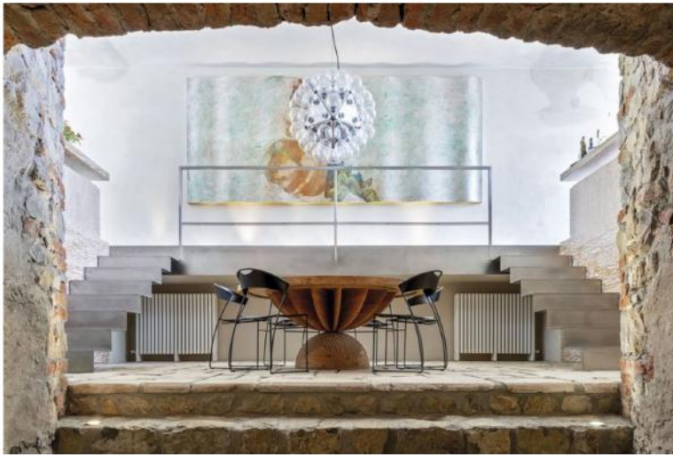
Realización: Bruno Boretti. Texto: Ainhoa Ruiz de Morales Francesca Anichini

Repasamos el Salone del Mobile y de la Milan Design Week con los diez exquisitos diseños que más nos fascinaron entre las nuevas creaciones de los mejores diseñadores del mundo que hemos ido descubriendo. También alzamos la mirada para admirar las lámparas-joyas que cada vez tienen más protagonismo, como este diseño del argentino Francisco Gómez Paz.