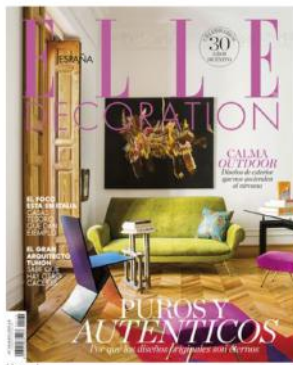
Elle Decoration Mayo 174. Ya a la venta.