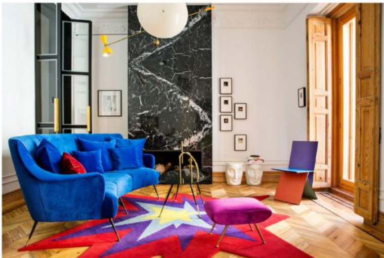
Realización: Mercedes Ruiz-Mateos. Texto: Ana Rodríguez Frías Pablo Sarabia

Descubre la colorida casa de nuestra portada, llena de arte contemporáneo y diseño, del tándem formado por los arquitectos, diseñadores y galeristas David Pérez Fernández (Dapefe) y Davide Ridenti. Un vibrante mix donde el estilo clásico y el diseño más innovador se juntan para crear una sucesión de estancias que nos recuerdan a los palazzos italianos. Aprovechamos para descubrir también el refugio del arquitecto y diseñador milanés Davide Rizzo entre las colinas cubierta de viñedos en la región de Abruzzo.