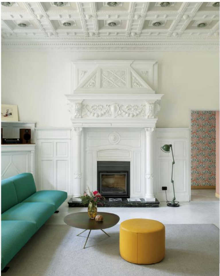
Realización / Texto: Barbara Vergnano / Sloby y Beatriz Fabián (texto) Denise Bonetti / Living Inside