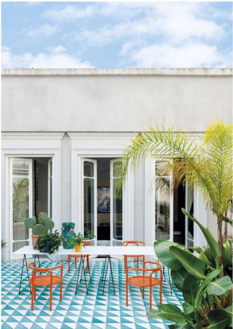
Realización: Chiara Dal Canto Production. Texto: Sonia Cocozza. Adaptación: Tachy Mora Nathalie Krag / Living Inside